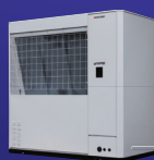
CO 2 Heat Pump [unimo]