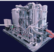
Ne Turbo Brayton Cycle Refrigerator [BraytonNeO]